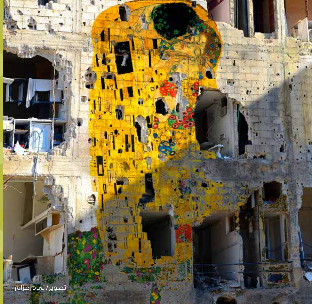
تصوير / تمام عزازم